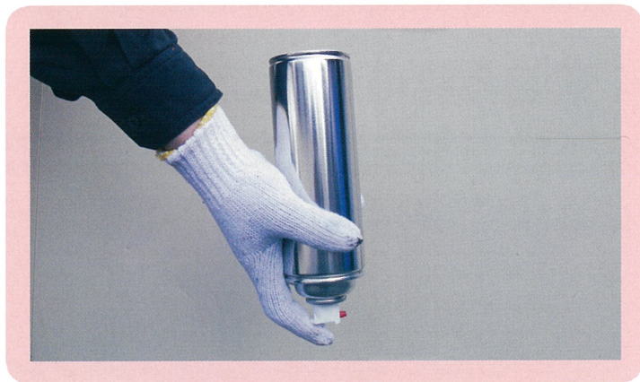
④…使用後は空吹きしてください